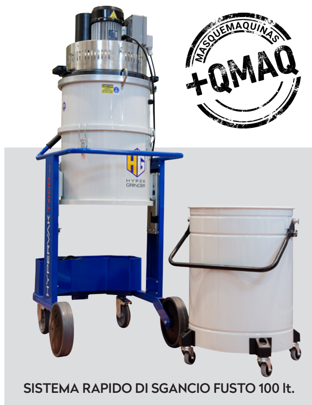
SISTEMA RAPIDO DI SGANCIO FUSTO 100 lt.